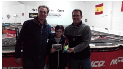
T800 BlackArrow Evotec

Al final, entrega de trofeos conmemorativos de esta resistencia nocturna y la foto de cada equipo por orden de clasificación de izquierda a derecha y de arriba abajo. Agradecer a Black Arrow, Aloy Shop y Spirit su colaboración para la realización del evento.