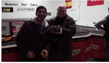
Pilot Slot Team