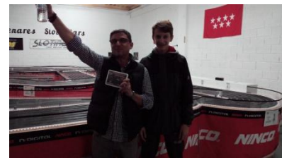
DAC Sport Auto