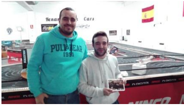
New Slot Team