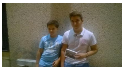
T800 BlackArrow Evotec Jr.