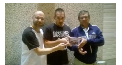
Slot Car Center