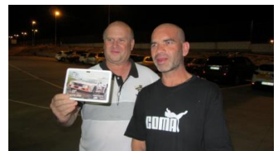
Pilot Slot Team