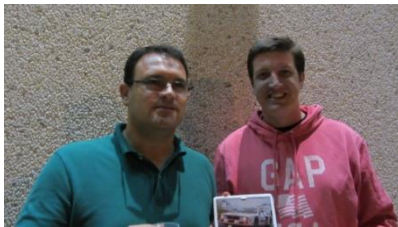
T800 BlackArrow Evotec

Entrega de trofeos conmemorativos de estas 4 horas grupo 5 y la foto de cada equipo por orden de clasificación de izquierda a derecha y de arriba abajo. Agradecer a Aloy Shop y a Spirit su colaboración para la realización del evento y en conclusión, una magnífica velada dedicada al slot y a los amigos que compartimos esta maravillosa afición, nuestros queridos cochecitos, como dice un ilustre de este campo.