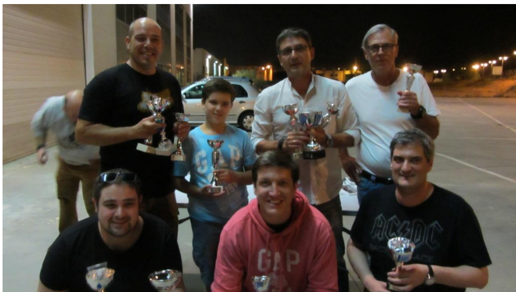
Campeones HSC temporada 2015 - 2016