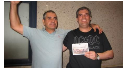
DAC Sport Auto