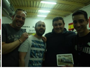
2º Los 4 Fantásticos