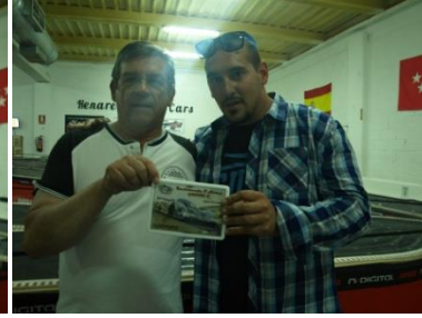
6º Slot Cars Center - Black