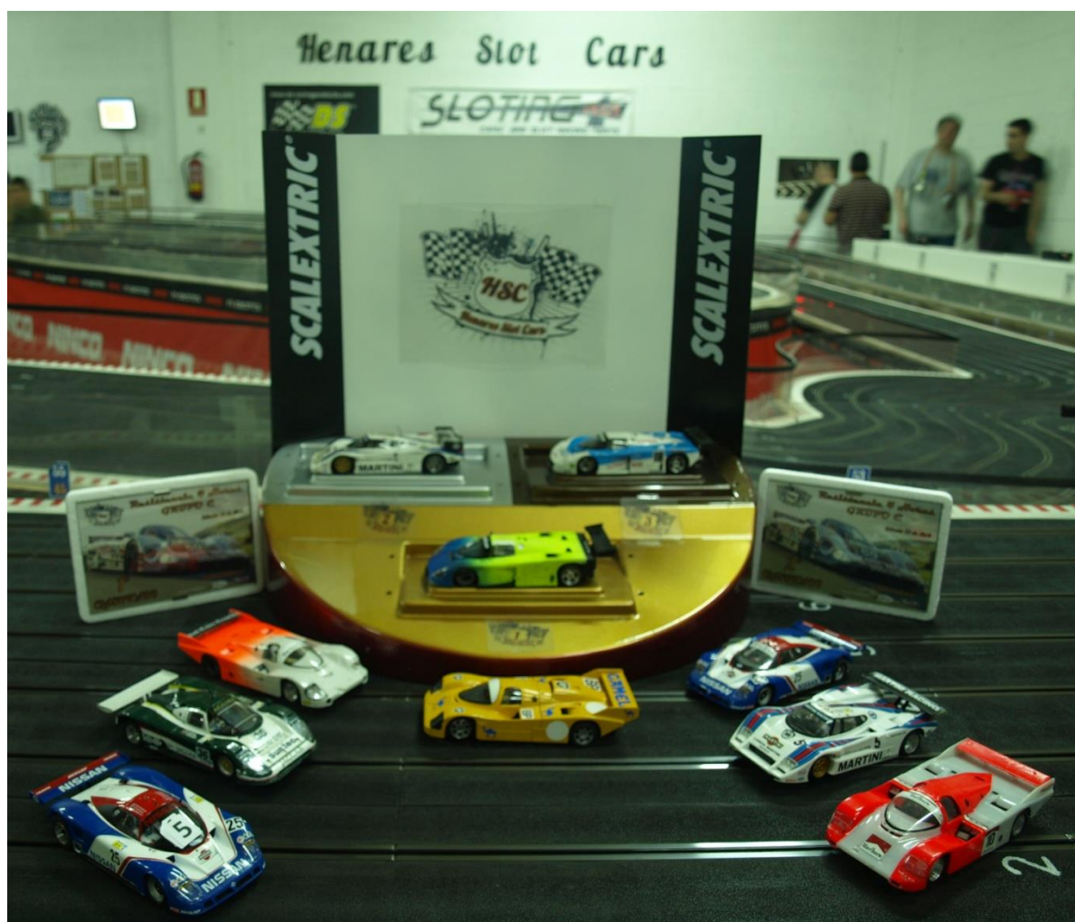
Foto del pódium con todos los participantes y entrega de trofeos conmemorativos de estas 4 horas grupo C. Después figura la foto de cada equipo, con ausencia justificada de algún participante. No podemos olvidar desde HSC agradecer a nuestros patrocinadores Black Arrow , Aloy Shop y Spirit su importante colaboración para la realización de esta carrera.