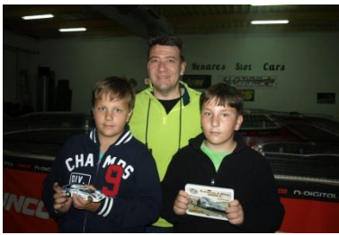
10º Endureros On Road