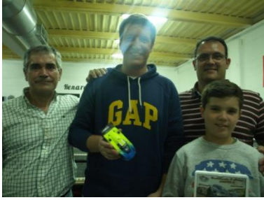
1º T800 BlackArrow Evotec