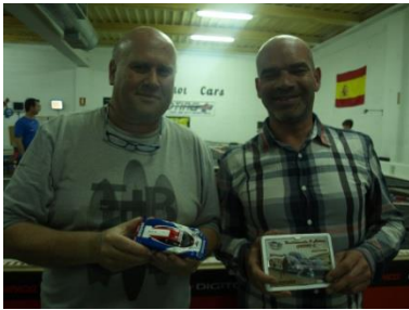
7º Pilot Slot Team