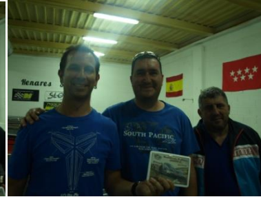
9º Slot Cars Center - White