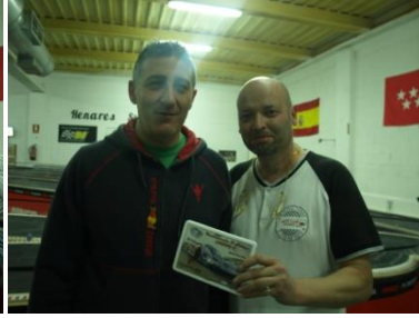
5º Slot Cars Center - Red