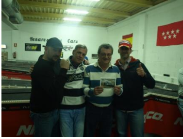
4º CyC - Tucán